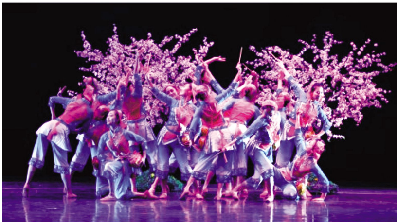
群舞《桃花红》获第十二届省“五星工程奖”金奖

末”展演活动在崇安寺、南禅寺、江阴天华文化中心、宜兴文化广场等数十个广场和文化场所举办超过100场专场演出,近百个群众特色文化团队参与展演,为广大市民送上群众文化盛宴。