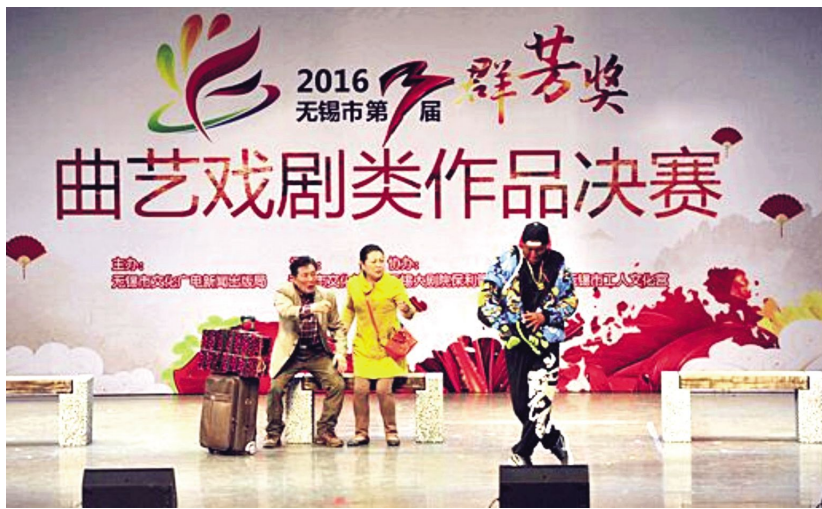
第三届“群芳奖”曲艺戏剧类作品决赛现场

2016年,无锡市“激情周末”广场文艺展演全新推出各项“非遗”类节目,让传统文化活跃在“激情周末”的舞台上。展演活动从创新组织形式入手,将原有的演出评比模式转变为文艺展演模式,首次面向全社会征集年度专场演出,更广泛地搭建群众展演舞台,更深入地挖掘全市群文资源,不断满足市民文化需求,演出内容和场次较之以往都有较大突破。从5月份活动启动至年底,“激情周