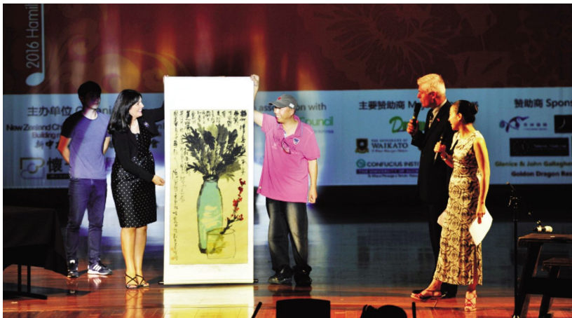
哈密尔顿新春音乐会现场创作作品《中国水墨画与古琴》