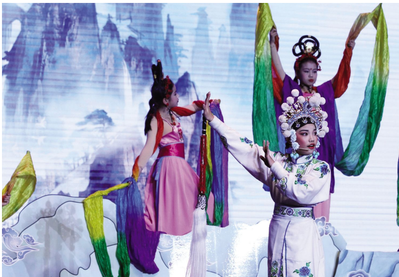
“小小红梅奖”少儿锡剧邀请赛