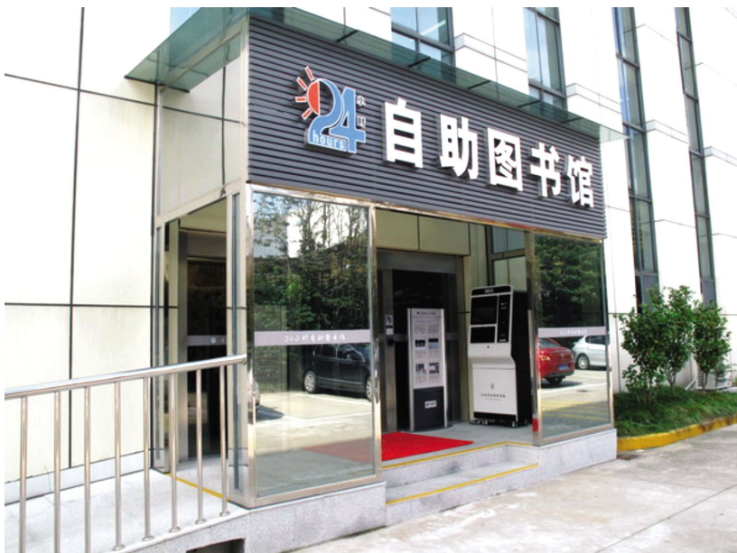
无锡首个24小时自助图书馆投入使用