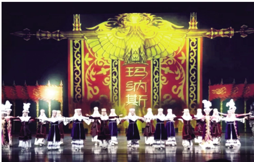
舞剧《英雄·玛纳斯》获第五届全国少数民族文艺会演银奖

【无锡青年画家油画展】 9月22日,由市文广新局主办的“传承与创新——2016无锡青年画家油画展”在无锡美术馆开幕并举行颁奖仪式。开幕式上,《传承与创新——2016无锡青年画家油画集》同时发布,13位青年画家获优秀奖证书,53位青年画家获入选证书。此次油画展是无锡美术馆(无锡市书画院)年度的重点目标任务,也是无锡美术馆为无锡青年画家搭建的美术创作平台,更是无锡美术馆大力弘扬社会主义核心价值观,开展“深入生活、扎根人民”