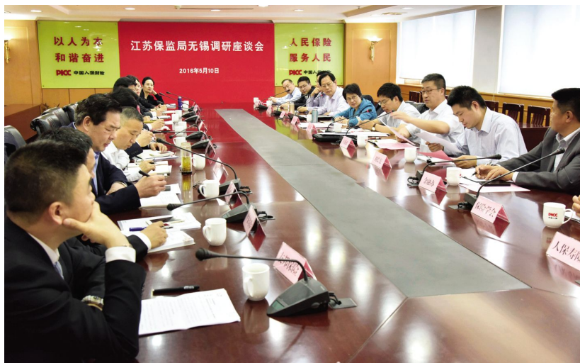
江苏保监局调研无锡保险市场

【优化推进江阴“新农合”】 年内，太平洋寿险无锡分公司推进江阴“新农合”管理水平持续优化，致力于构建“新农合”高效管理体系，发展商业补充保险，完善多层次医保体系，扩大服务范围。至年末，江阴“新农合”服务人数 54.16 万人，累计结报 259.81 万人次，结报金额 43335.63 万元。其中，住院结报 9.86 万人次，结报金额 37441.18 万元；门