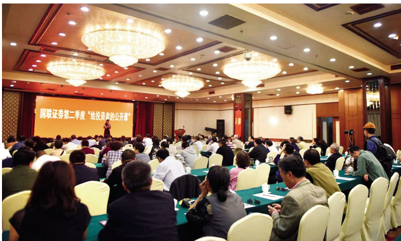
给投资者的公开课

【国联证券开展多元化资本市场服务】 年内,国联证券股份有限公司以“新三板”挂牌融资与投资一条龙服务等途经,挖掘企业在资本运作、收购兼并、市值管理、股权融资等方面的市场潜力,通过多元化资本市场服务助力企业发展,服务实体经济。全年公司完成“新三板”挂牌企