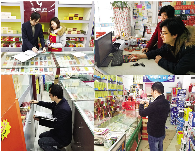
无锡烟草专卖局细化营销管理

【食盐安全宣传】 2016年,无锡市盐务管理局丰富创新多种宣传形式,营造“人人关心食盐安全、人人维护食盐安全”的良好氛围。开展“3·15”“5·15”“食盐安全宣传周”“《无锡市盐业管理条例》颁布实施八周年”等主题日广场宣传活动,会同全市各级卫生、疾控、卫生院、社区开展规模不等的食盐安全知识广场宣传40余场次,开展盐业法规、防治碘缺乏病、食盐安全科普知识宣传。会同市疾控中心发布告全