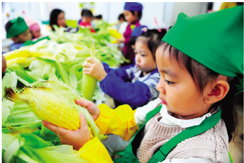
10月14日,在“世界粮食日”的来临之际,小朋友们进行剥玉米比赛,树立节粮、惜粮意识